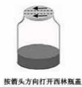
图 1 西林瓶开启图

注意：如有特殊的接种方式、培养时间或培养方式，请详见每种生化鉴定管附带的使用说明。